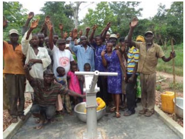
Das ganze Bau-Team und unsere Mitarbeiter am Borehole.

Unfortunately, because of credit card problems we couldn't start the installation of the needed hand pump and so the scheduled date for the celebration with the inhabitants of the villages couldn't take place on the 14th May.