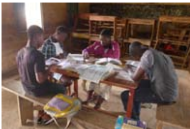
Asedaye Kinder beim Lernen für Prüfungen.

We wish them the very best in their exam.