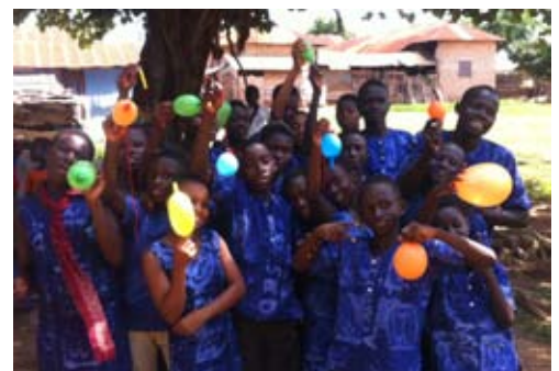
Bunte Impressionen mit den Asedaye-Kindern.

Die erste Herausforderung, die englische Sprache zu beherrschen, habe ich zu meiner Zufriedenheit sehr schnell gemeistert. Dann war da aber noch das Essen. Bei aller Liebe, die ghanaische Küche ist in meinen Augen ziemlich gewöhnungsbedürftig und für mich als Deutschen, der anderes Essen gewohnt ist, geradezu miserabel. Ich hatte durch das Essen meine Probleme und habe fast nur Reis in dieser Zeit gegessen. Wo andere ihre Probleme mit Heimweh oder anderen üblen Krankheitsgeschichten hatten, war wohl rückblickend das Essen mit dem ich am meisten zu kämpfen hatte, aber ich habe es überstanden. Ich hätte echt nicht gedacht dass man deutsches Essen so vermischen kann – aber kann man definitiv, das weiß ich jetzt.