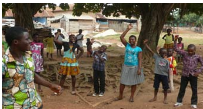
Die Asedaye-Patenkinder in Action.