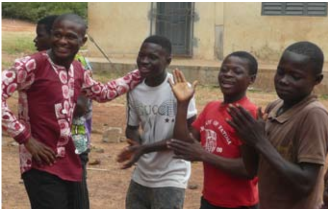
Koordinator Abedinago (links) zusammen mit Patenkindern.